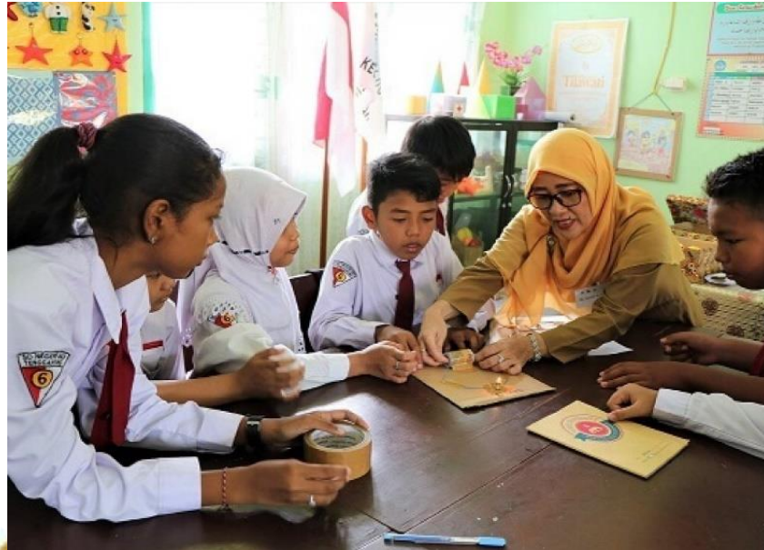
Gambar 2: Kelancaran Selama Proses Belajar Mengajar