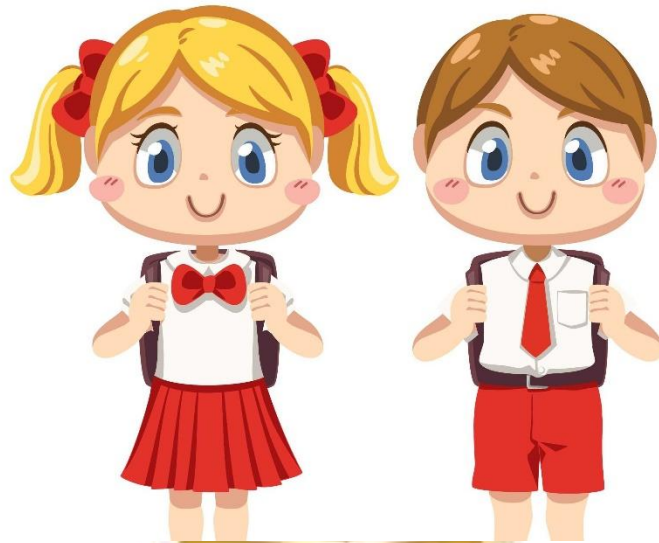
Gambar 4: Memakai Atribut Sekolah