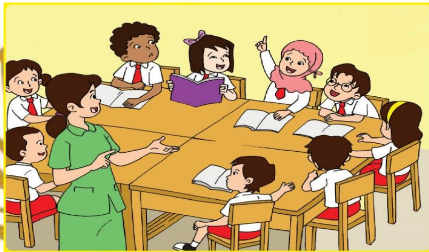
Gambar 6 : Mendapatkan Materi Pelajaran

Seorang murid juga memiliki hak untuk mendapatkan materi pelajaran sesuai dengan tingkatannya. Guru harus memberikan materi kepada siswa dan menjelaskan dengan baik dan sejelas-jelasnya.