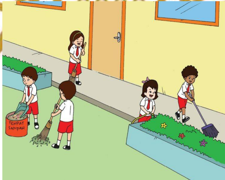
Gambar 5: Menjaga Kebersihan Sekolah

Menjaga kebersihan lingkungan sekolah adalah tanggung jawab dan kewajiban seluruh warga sekolah terutama siswa.