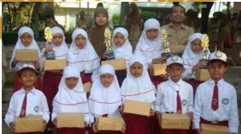
Gambar : 3 Menjaga Nama Baik Sekolah

Menjaga nama baik sekolah juga merupakan kewajiban dari seorang murid, untuk melakukan kewajiban ini siswa dilarang melakukan hal buruk dengan menggunakan atribut sekolah.