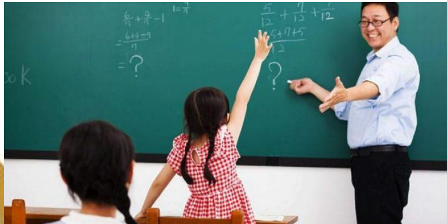
Gambar 8 : Gambar Hak Bertanya

Hak lain yang juga dimiliki siswa adalah bertanya pada guru saat proses belajar mengajar berlangsung atau diluar jam belajar. Siswa juga memiliki hak untuk menyampaikan pendapat baik tentang pelajaran atau suatu yang terjadi disekolah.