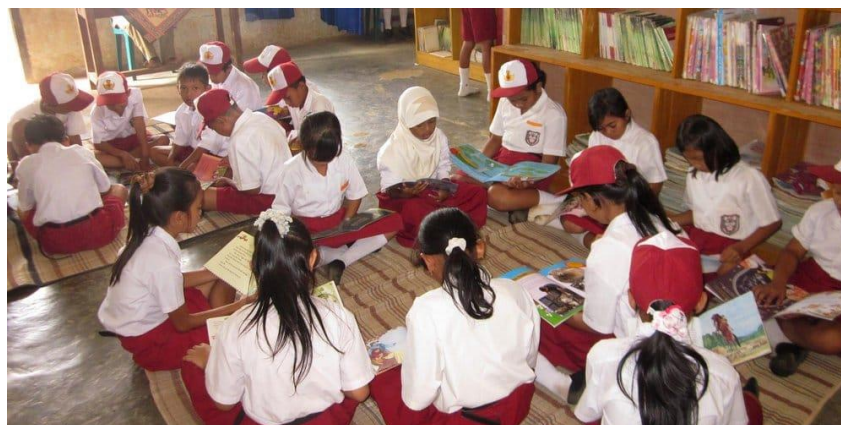
Gambar 7 : Gambar Menggunakan Perpustakaan

Setiap siswa juga berhak untuk menggunakan semua fasilitas sekolah yang sudah disediakan, seperti perpustakaan alat olahraga dan lain sebagainya.