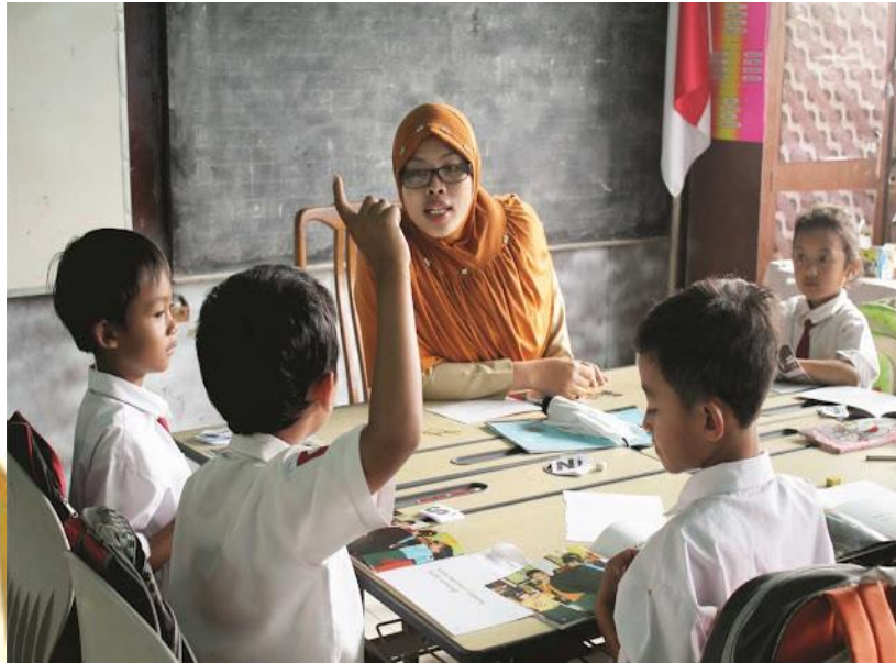
Gambar 1 : Proses Belajar Mengajar

Seorang siswa memiliki kewajiban utama dengan mengikuti semua proses belajar mengajar yang ada di sekolah. Hal ini supaya siswa mendapatkan ilmu sehingga dapat melanjutkan kejenjang pendidikan selanjutnya.