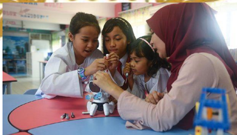
Gambar 9 : Gambar Mendapatkan Perlakuan Adil

Setiap siswa juga mendapatkan perlakuan yang adil tidak dibeda-bedakan berdasarkan latar belakang budaya, ras, suku dan perbedaan lainnya.