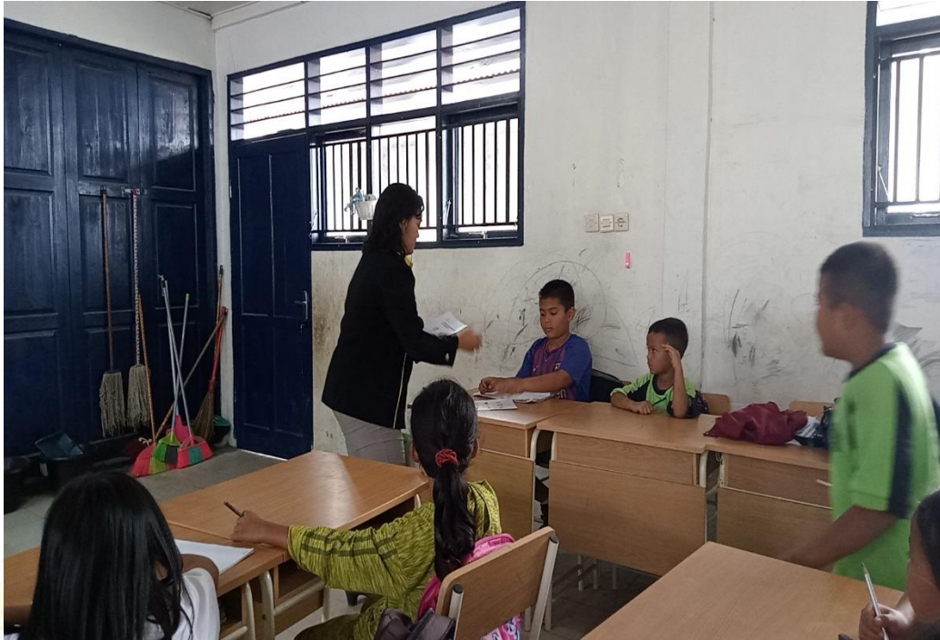
Pemberian soal pada Siklus I