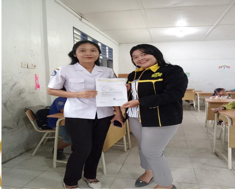
Peneliti memberi surat keterangan kepada wali kelas II