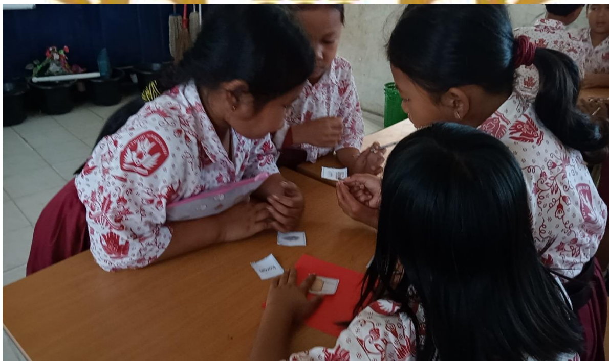
Siswa mengerjakan soal