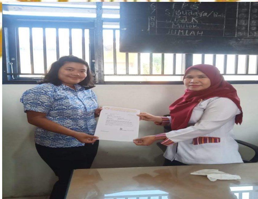
Peneliti memberi surat keterangan kepada kepala sekolah