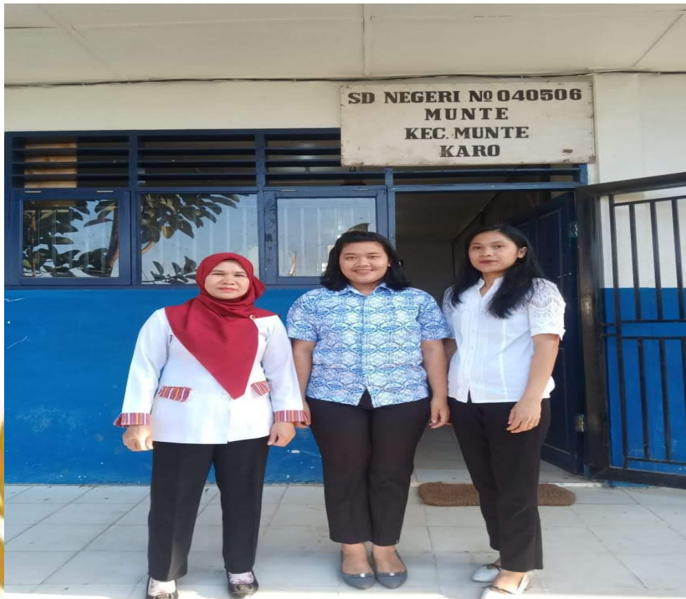
Peneliti foto bersama kepala sekolah dan wali kelas II