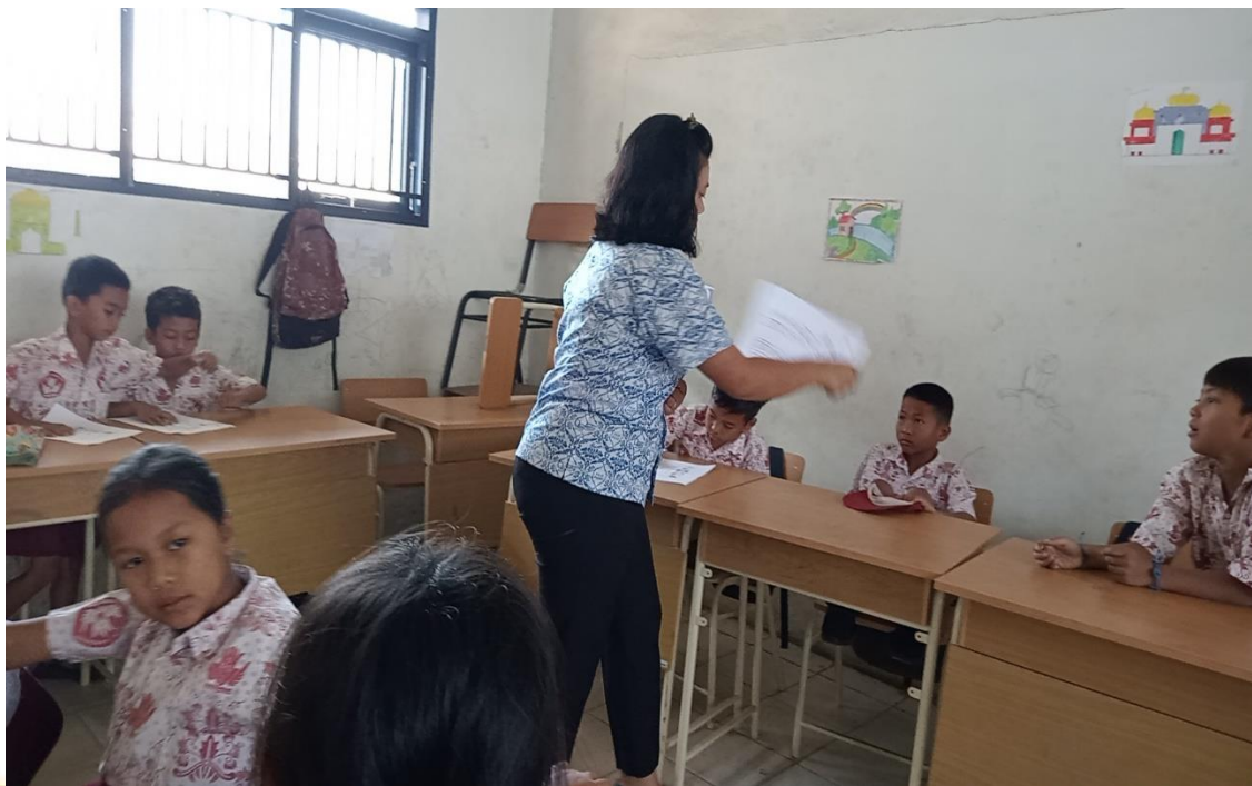
Pemberian soal pada Siklus II