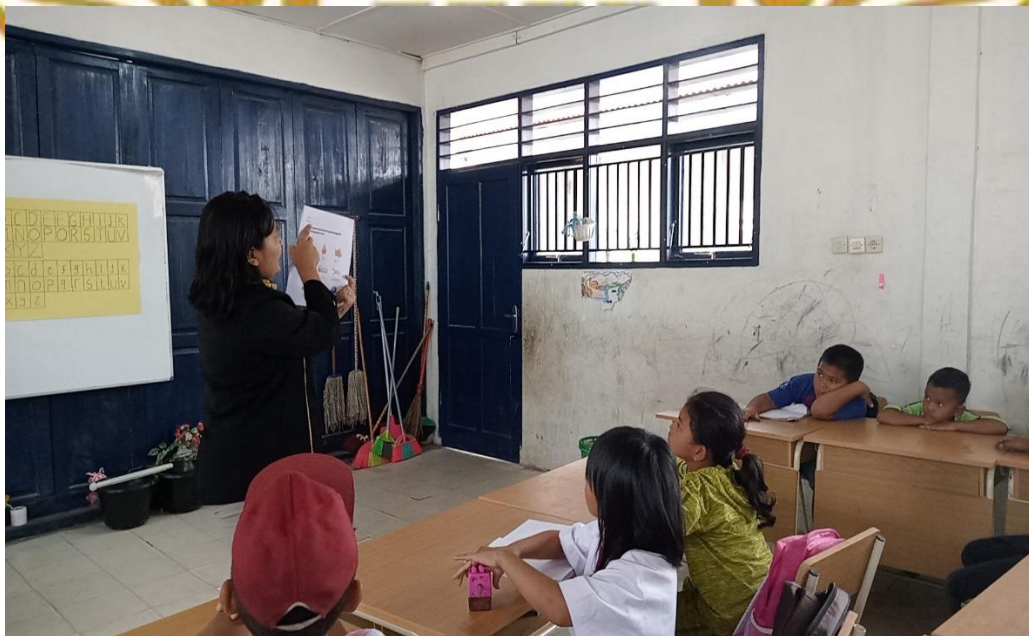
Penyampaian materi pada Siklus I