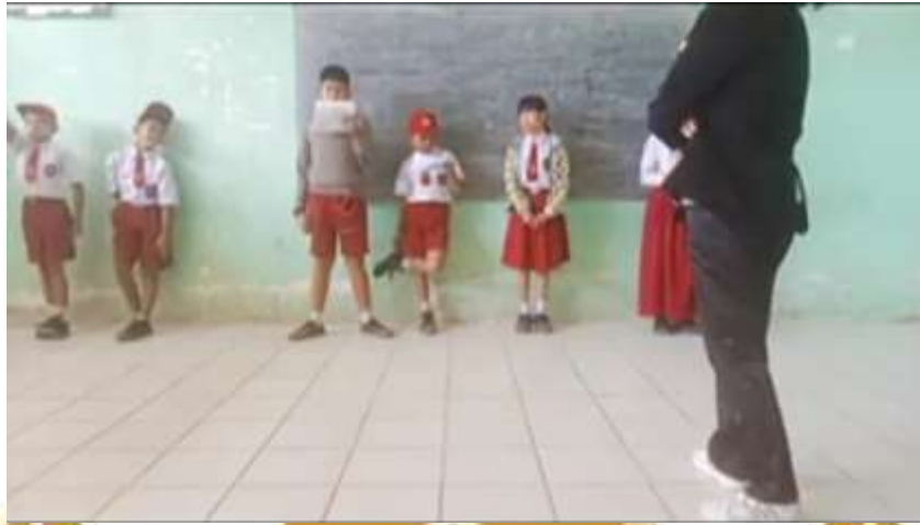
Siswa sedang melaksanakan kegiatan drama