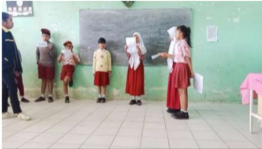
Guru meminta siswa memperhatikan temannya