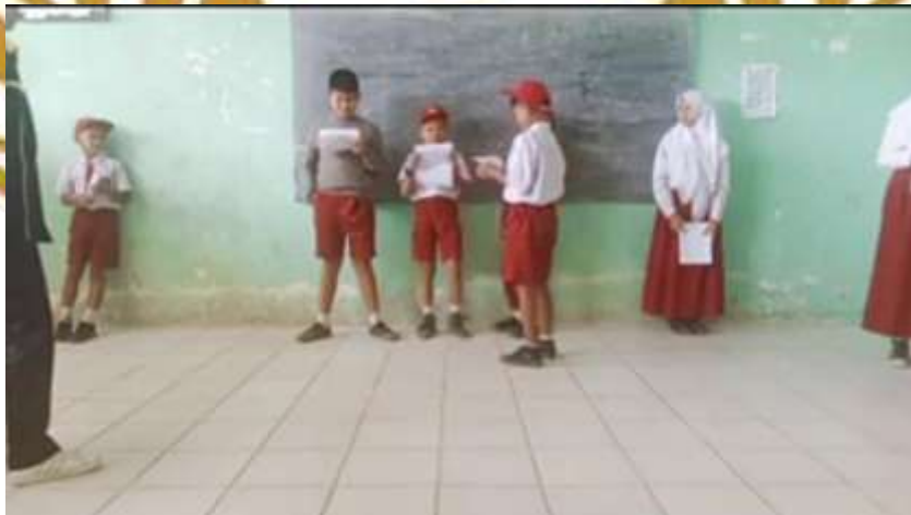
Salah satu siswa membaca naskah drama