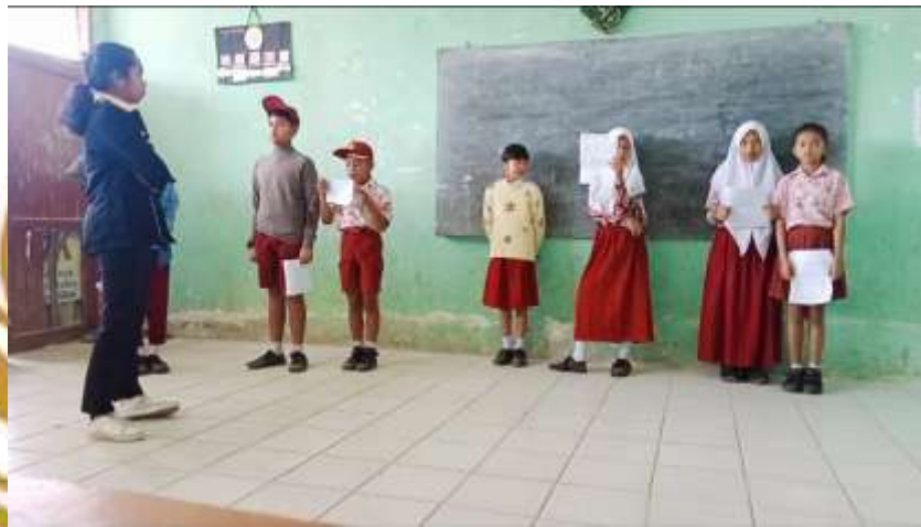
Siswa membacakan naskah terakhir dalam drama