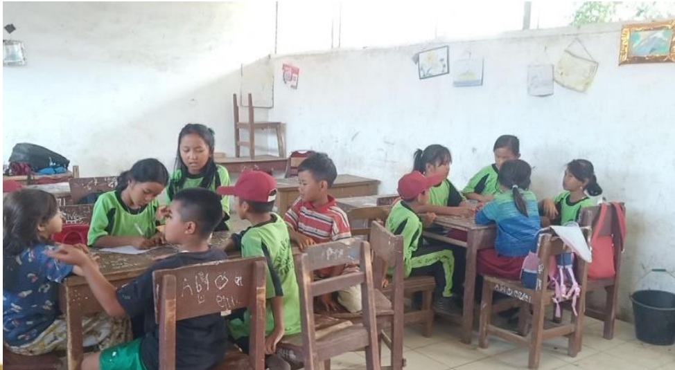
Gambar 11. Peneliti membagi siswa menjadi beberapa kelompok