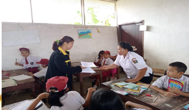
Gambar 3. Menyerahkan Lembar Observasi Kepada Guru Kelas (Observer)