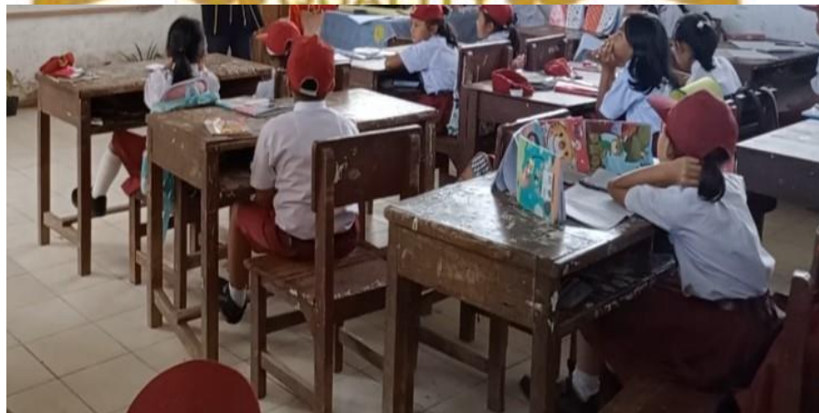
Gambar 10. Peneliti mengadakan Apersepsi