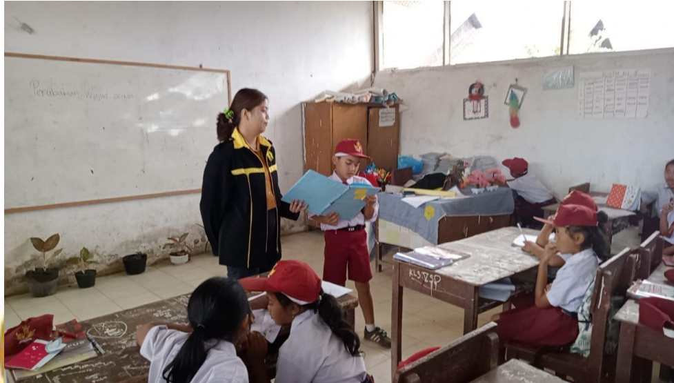
Gambar 9. Peneliti mengarahkan siswa untuk membuat dan membacakan kesimpulan