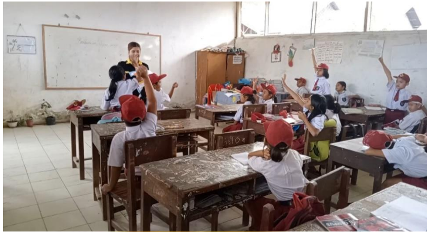
Gambar 6. Peneliti Membagi Soal Kepada Siswa