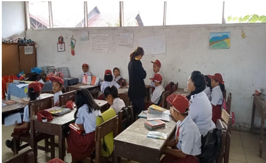
Gambar 13. Peneliti membagi soal dan memantau siswa dalam mengerjakan soal