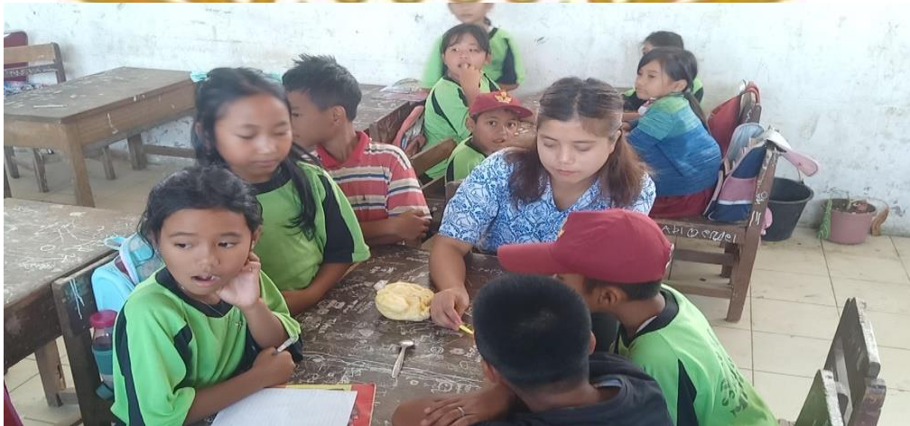
Gambar 12. Peneliti menerangkan Materi Siklus II kepada masing-masing kelompok dan Membimbing siswa untuk melaksanakan pengerjaan tugas kelompok.