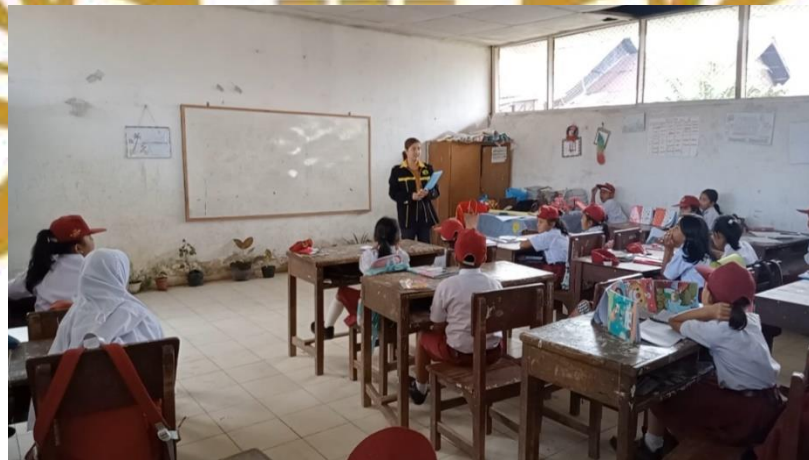
Gambar 4. Peneliti Mengadakan Apersepsi