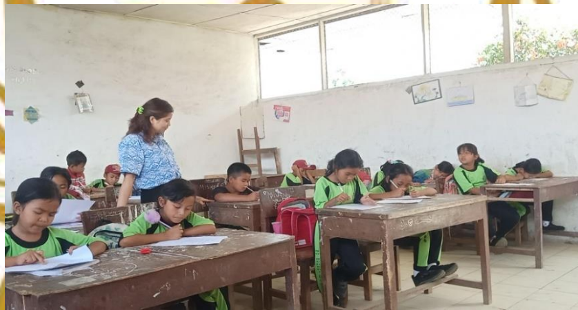
Gambar 7. Siswa Mengerjakan Soal