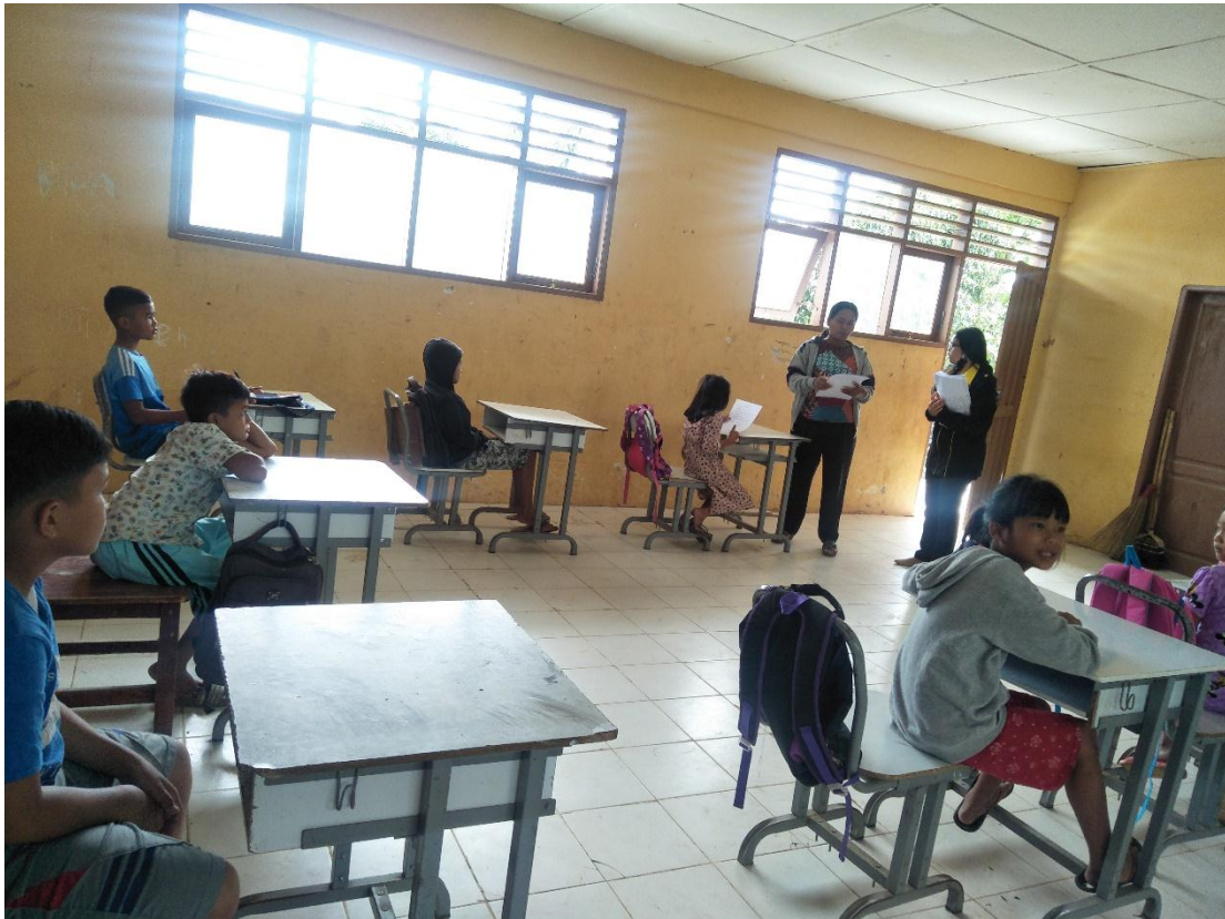
Foto 3, 4, 5 : Membagikan angket di SD Negeri 047173 Cimbang Ujung