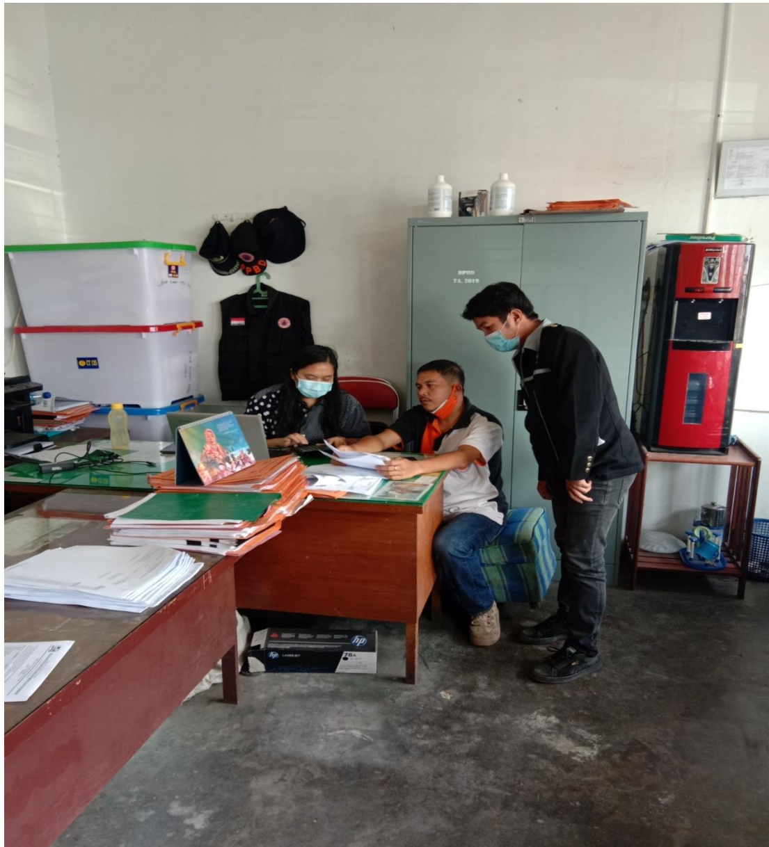
Dokumentasi saat wawancara dengan Bapak/ibu Pegawai Bagian SEKSI Logistik Badan Penanggulangan Bencana Daerah BPBD Kabupaten Karo Pada Tanggal 09 Juni 2021 pukul 09.00 Wib