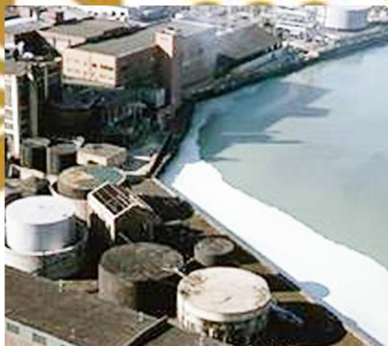
Gambar 2.3 (a) Penyebab pencemaran udara (b) Penyebab pencemaran tanah (c) Penyebab pencemaran air