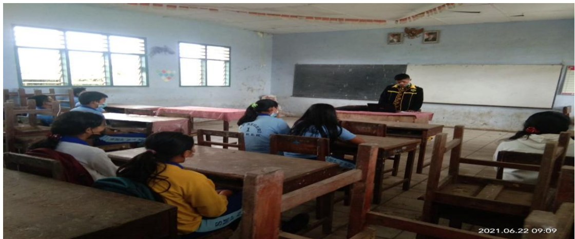
Foto Dokumentasi Penelitian