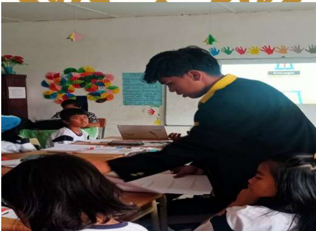
Penggunaan Media Canva