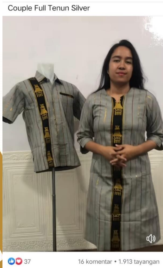
Foto 4,5,6,7 : Promosi yang dilakukan Butik Ester Holi Etnik Karo Kabanjahe menggunakan Media Sosial