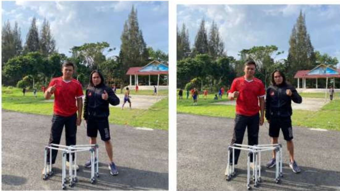
Gambar 5 1 Meminta Izin Untuk Penelitian