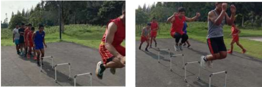
Gambar 5.3 Penerapan Metode Hurdle Hops