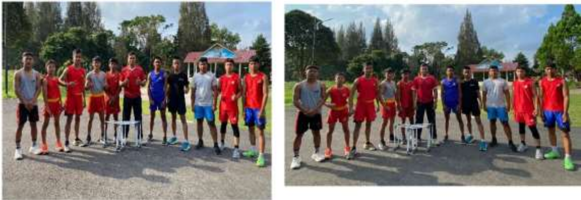
Gambar 5 5 Foto Bersama Atlet Junior