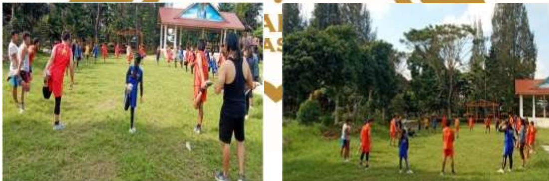
Gambar 5 2 Pemanasan