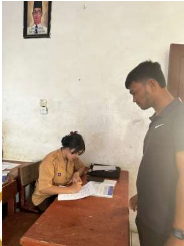
Pengumpulan pengisian kuesioner