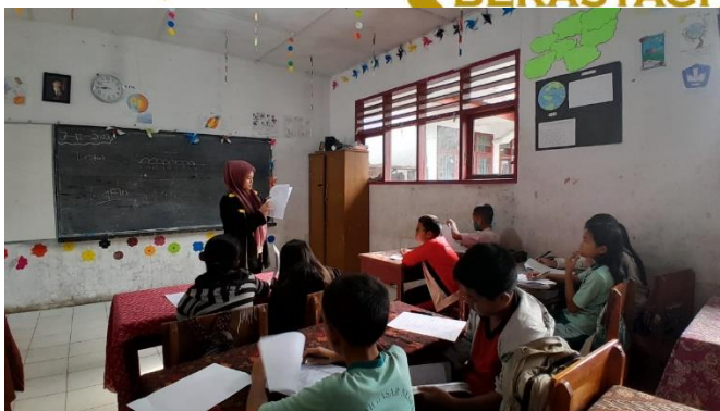
Siswa mengerjakan angket