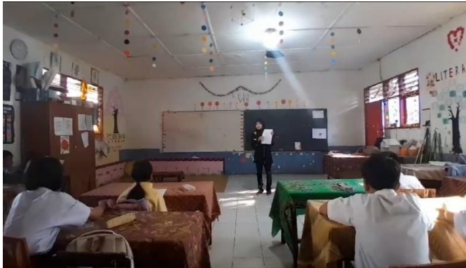
Siswa mengerjakan angket