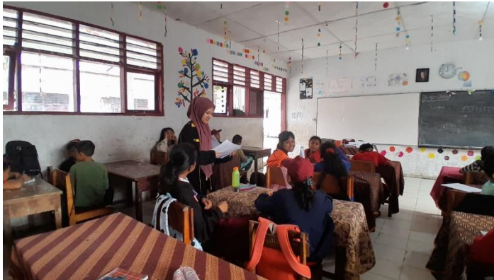
Peneliti mengumpulkan soal angket