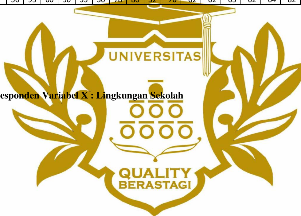
Lampiran 4. Hasil Data Responden Variabel X : Lingkungan Sekolah