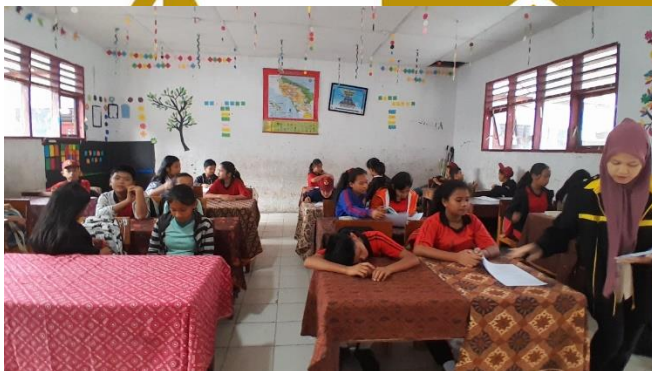
Peneliti membagikan soal angket kepada siswa