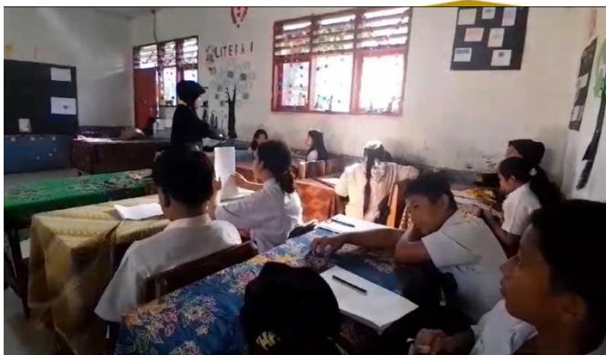
Peneliti mengumpulkan soal angket