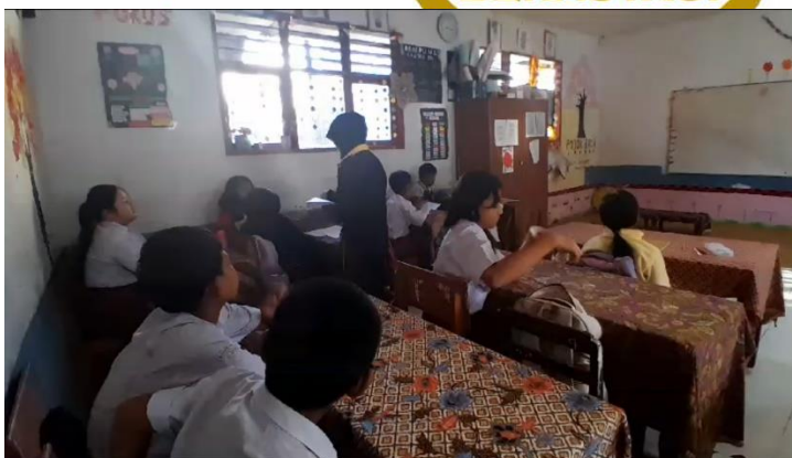
Peneliti membagikan soal angket kepada siswa