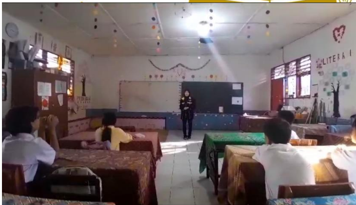
Peneliti menjelaskan cara pengisian angket