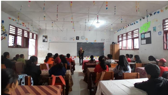
Peneliti menjelaskan cara pengisian angket