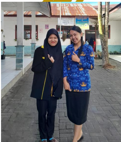
Foto bersama wali kelas VI-B