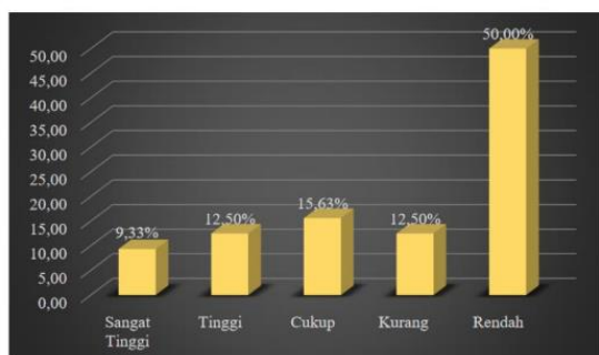
Gambar 1. Diagram Kemandirian Belajar

Tabel 1 menunjukkan bahwa kategori belajar siswa di SD 020261 Binjai yaitu pada kategori sangat tinggi sebanyak 3 orang (9,38%), kategori tinggi 4 orang (12,50%), kategori cukup 4 orang (12,50%), kategori rendah 16 orang (50%). Sehingga berdasarkan hasil temuan dapat disimpulkan bahwa kategori kemandirian belajar siswa termasuk dalam kategori rendah dengan tingkat persentasi sebesar 50%.